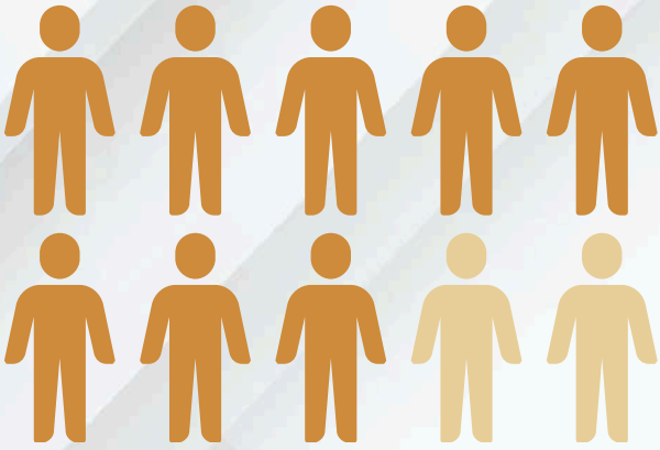
Şema 1.0 : 10 tüketiciden 8'i ilk siparişlerinin ardından yeni bir sipariş için yeniden Global City'i tercih ediyor.